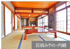
民宿みやの・内観