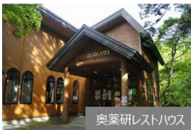
奥薬研レストハウス