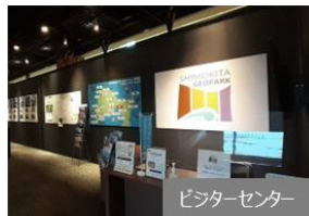
ビジターセンター