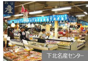
下北名産センター