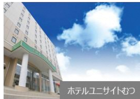
ホテルユニサイトむつ