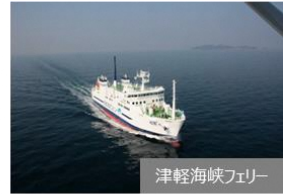
津軽海峡フェリー