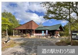
道の駅かわうち湖