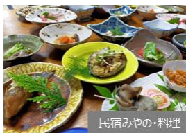
民宿みやの・料理