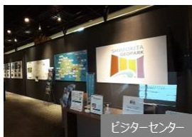
ビジターセンター