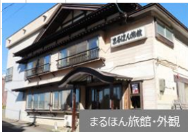
まるほん旅館・外観