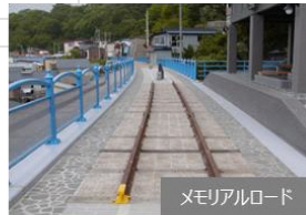
メモリアルロード