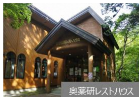
奥薬研レストハウス