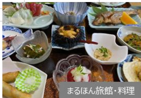
まるほん旅館・料理