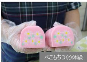
ペこもちづくり体験