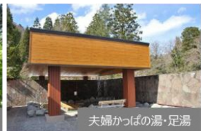
夫婦かつぱの湯・足湯