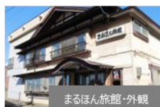
まるほん旅館・外観