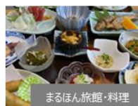
まるほん旅館・料理