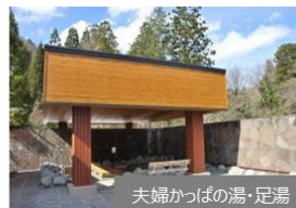
夫婦かつぱの湯・足湯