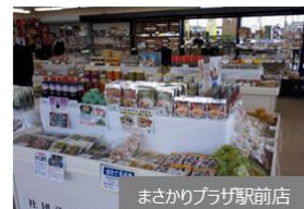
まさかりプラザ駅前店