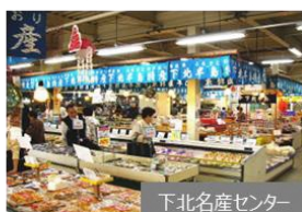
下北名産センター